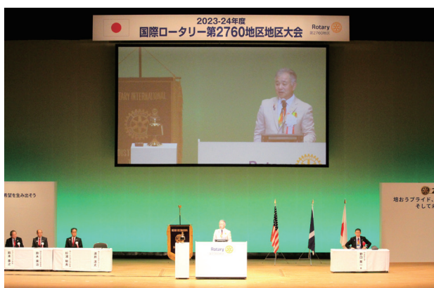
2日目本会議 舞台上の様子