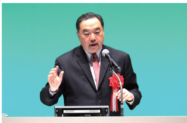
記念講演 講師 徳川宗家19代当主 徳川家広氏