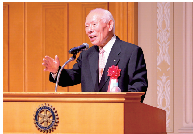
特別講演 講師 2012-13年度RI会長 田中作次氏