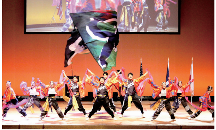
オープニングアトラクション どまつり演舞チーム「笑舞」