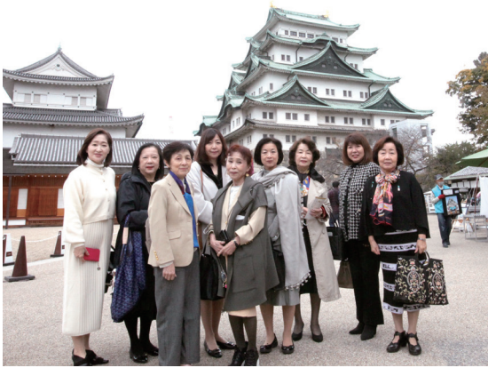
ファミリープログラム