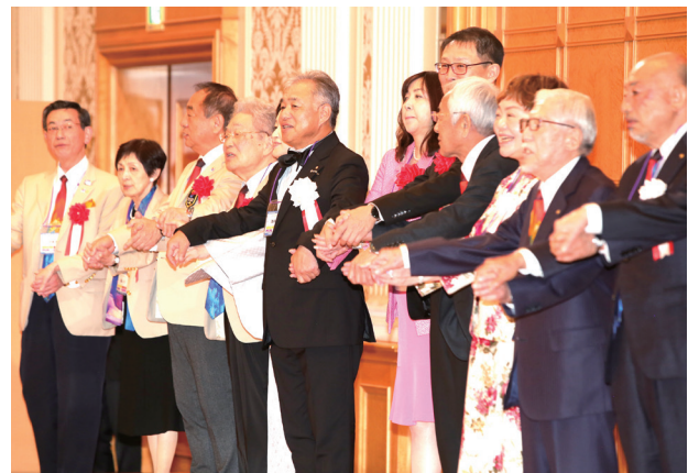
晩餐会手に手つないで