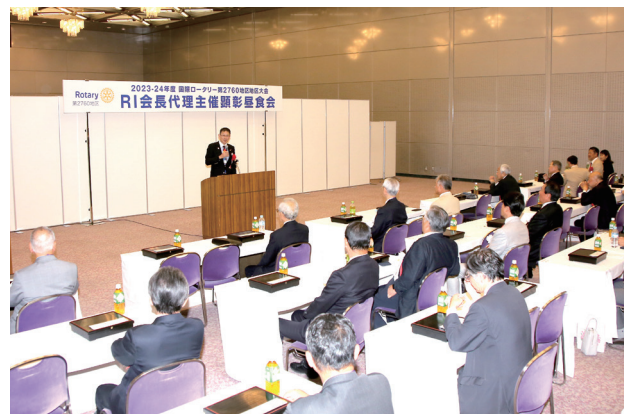
RI会長代理主催顕彰昼食会