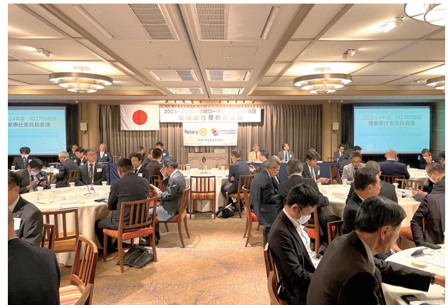
職業奉仕委員長会議風景