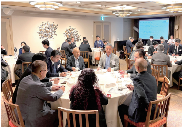
グループディスカッション風景