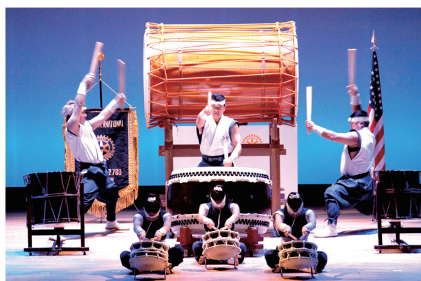
記念講演オープニングアトラクション 松平わ太鼓