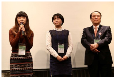
学友会が支援する日本人留学生もあいさつ