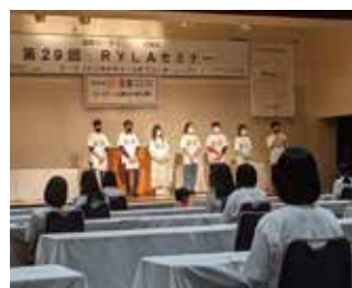
※RYLAセミナー受講風景