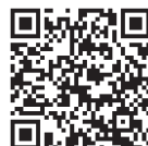
グローバル補助金