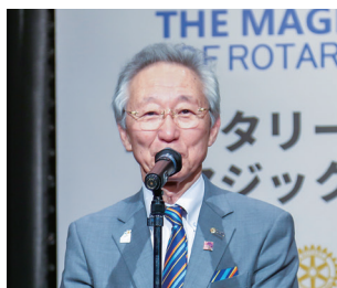
ガバナーあいさつ