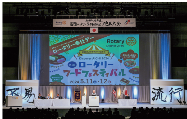
【2日目】本会議 主催者挨拶及び現況報告