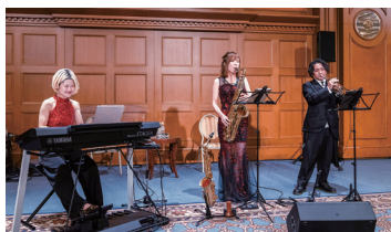
【1日目】晩餐会オープニングアトラクション