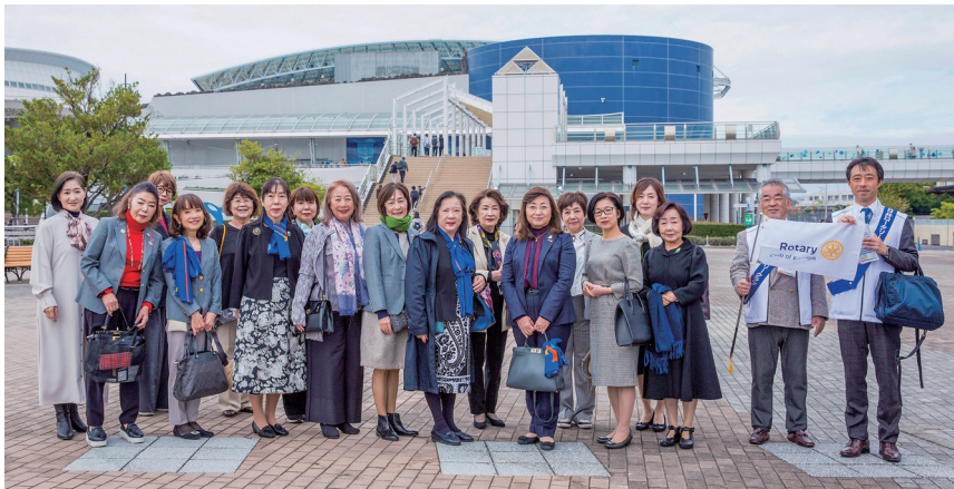
【2日目】ファミリープログラム

一方、地区内外の特別出席者のパートナーをご案内するファミリープログラムでは、名古屋港水族館を見学し、昼食では「あつた蓬莱軒本店」で名古屋の味を堪能していただきました。その後、国際会議場に移動し和菓子作りの体験をしたのち、本会議場の記念講演に合流いたしました。