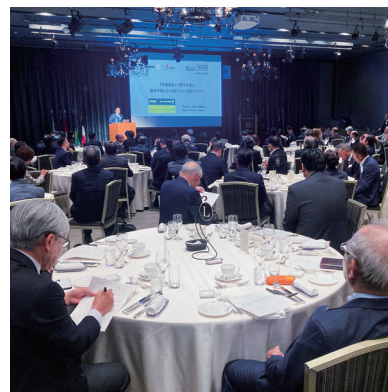
約130人が参加した会員増強セミナー