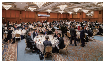
【1日目】晩餐会歓談風景