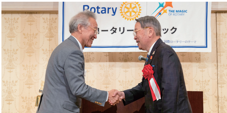
【1日目】本会議 握手を交わすRI会長代理とガバナー

11月9日・10日の両日、国際ロータリー第2760地区地区大会を名古屋観光ホテル及び名古屋国際会議場にて開催いたしました。