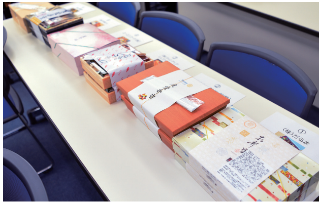
【2日目】協力企業6社お弁当

二日目、今年度は大会を短時間に納めるという方針のため顕彰昼食会や皆様の昼食から始まりました。特に今回初めての試みは、お弁当を地区内のロータリアンが経営する会社から調達しようという実行委員長の発案から、6社のロータリアン企業にお願いし、各クラブに各社のお弁当が行き渡るように分配しました。