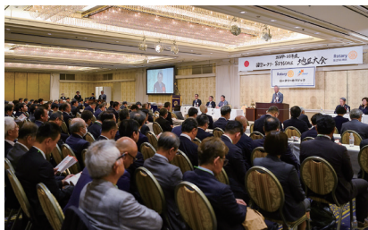
【1日目】本会議 会場の様子