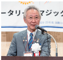
【1日目】本会議 ガバナー挨拶

その後、RI会長代理ご夫妻歓迎晩餐会は、懐かしい軽快なディスコミュージックなどの演奏で始まり、終始和やかな雰囲気で行われました。