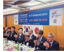
9.21大邱南嶺RC姉妹クラブ協約再締結