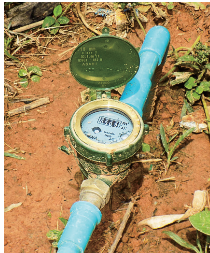
村民が使用料を管理する為の水道メーター