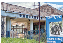
のんほいパーク入口