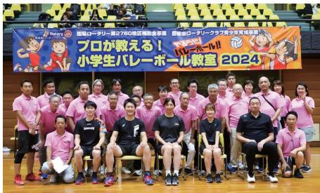
プロが教える!小学生バレーボール教室

本年度クラブテーマは「ロータリアンであることの誇り-親睦と奉仕-」です。ロータリークラブの原点を確かめつつ、変革に適應しなければならぬと思っております。会員であることを誇りとし、喜びとすることが、世代を超えていくカギになると思いま