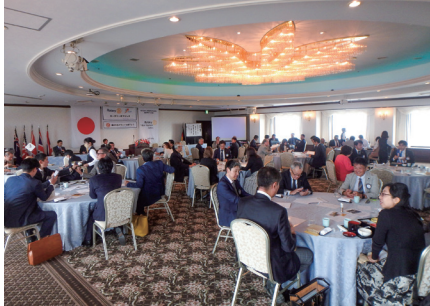
楽しい仲間の集い

豊橋ゴールデンRCは、1988年〈昭和63年〉10月28日、「金曜日に集う楽しい仲間達」を合言葉に、昭和の最後、平成で最初のクラブとして誕生しました。例会場は、JR豊橋駅から車で10分程の場所に位置する「ロワジュールホテル豊橋」。ホテル最上階30階で行われる例会場からは、豊橋の街並みを一望できる他、三河湾や近隣の山々の絶景を楽しめ