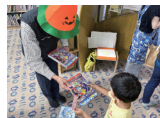
豊川宝飯RC参加者へのノートのプレゼント①