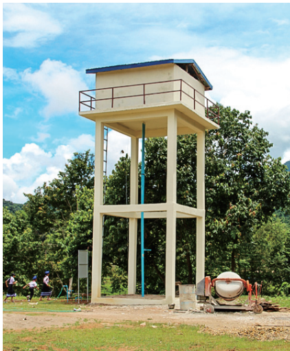
ナーセー村に建設した給水塔