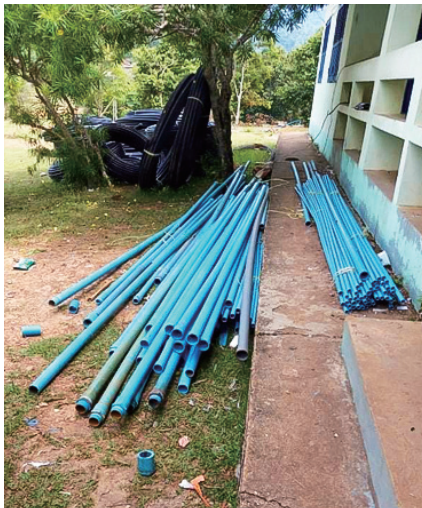
村民がメンテナンスする為の資材