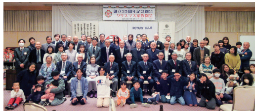
OB会員と共に35周年記念&クリスマス家族例会

会員が楽しく喜ぶ例会運営をしたいと考えています。今年はちょうどクラブ創設35年目にあたり、OB会員も一緒に参加できる例会も検討しています。また、同じ「半島」でもある能登半島の地震支援を昨年引き続き計画しています。これからも会員一丸となって頑張っていきたいです。