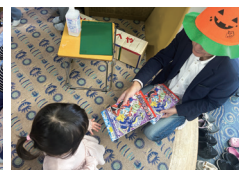
豊川宝飯RC参加者へのノートのプレゼント②