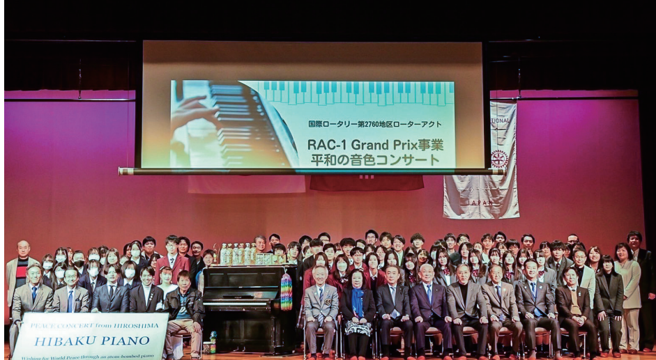
RAC-1 Grand Prix事業「平和の音色コンサート」集合写真

ローターアクトクラブはRIの加盟クラブとなり、これまでより大きな権限、責任を持つこととなり様々なセミナー、研修に参加しロータリアンと同様の活動や結果を求められるようになりました。現在、2760地区には9クラブ、約160名の会員が在籍し、そのうち2クラブが大学基盤のクラブです。他の7クラブも学生やサラリーマンが大半で会員数も10名程度のクラブが多い中、入会2～3年目で会長となることも珍しくありません。その様な状況の中、どこまでローターアクトに自立と責任を持たすべきなのか、どういったプランで進めていくべきなのかといったことはまだ議論の途中であり地域、クラブ規模も違う中、色々な意見やそれぞれの問題点があり答えは1つでないと思います。