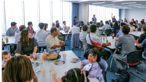
花火大会前の例会

本年度のクラブテーマは「照顧却下」～まずは自分の足元を見てみよう～です。会員相互が思いやり、足元を固め一丸となり、クラブ活動を楽しんでいます。7月末に開催した蒲郡まつり花火大会家族例会では大迫力の打ち上げ花火を楽しみました。