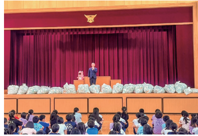
小学校にて回収のお礼