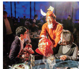
トナカイよりプレゼント