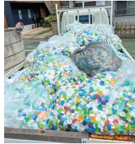
集まったペットボトルキャップ

これまで実施してきました75周年記念事業の一つ「ペットボトルキャップ大作戦！」では、昨年夏、市内小学校全52校に対しペットボトルキャップの回収をお願いしましたところ、約172万個のペットボトルキャップが集