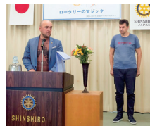
10.4アレクサンダー開発局長・ゴイコ先生別会卓話