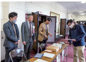
明るい家庭作り例会受付

豊橋南ロータリークラブは、「品格あるクラブを目指して」をテーマに掲げ、ロータリアンとしての品格を磨きながら、地域社会への貢献に努めています。特に青少年奉仕活動に力を入れており、「豊橋少年柔道大会」や「明るい家庭づくり推進大会」への支援を継続。子どもたちの頑張る姿に心を動かされ、青少年への支援の重要性を改めて認識しました。来年、クラブ創立60周年を迎えるにあたり、さらに青少年奉仕活動の支援を強化し、地域とともに歩むクラブとしての使命を果たしてまいります。