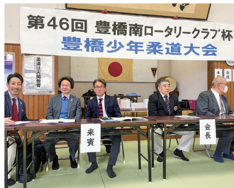
豊橋少年柔道大会