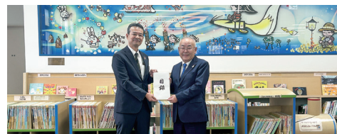
豊川宝飯RC修繕した椅子と机の贈呈式

今回は、新品購入ではなく、SDGsの観点から再生修理を豊川宝飯RCが行うことにしました。椅子43脚と机5台の修理は、毎年秋に行われている「秋の図書館まつり」に合わせて修理修繕を完了し、綺麗になった椅子と机を披露するとともに、図書館まつりのイベントの一つを豊川宝飯RCがお手伝いしました。読み聞かせの会の皆さんと協力してイベントを行い、参加してくれた子どもさんへノートをプレゼントさせて頂きました。