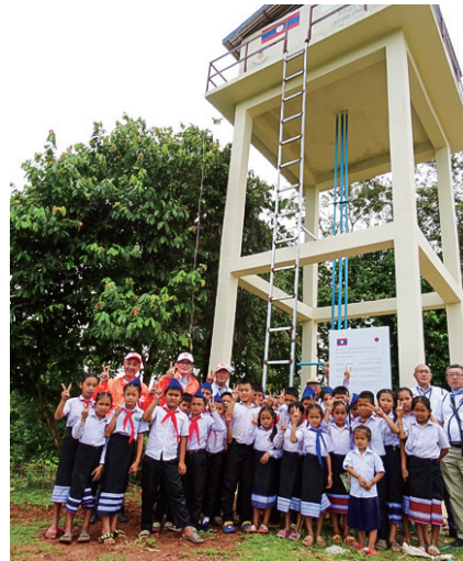
ナーセー村に建設した給水塔 2022年7月