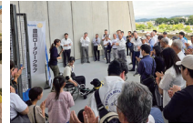
社会奉仕事業 介助犬デモンストレーション