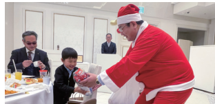
年忘れ親睦家族例会