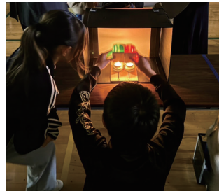
衝立に映る不思議な影