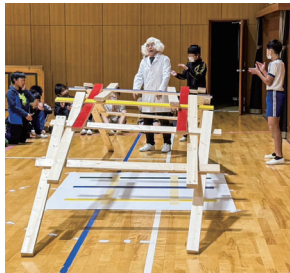
「レオナルドの橋」を組み立てる

また、継続事業として行ってきた地区補助金を活用した「小学校理科実験教室」を今年度は幸田町立幸田小学校6年生を対象に開催しました。小学校児童が中学、高校と進学するにあたり、興味あるものに対し、自主的自律的に学習する機会を提供することで、青少年の豊かな人間性を育むことに繋がることを確信し、今後も継続していきたいと思えます。