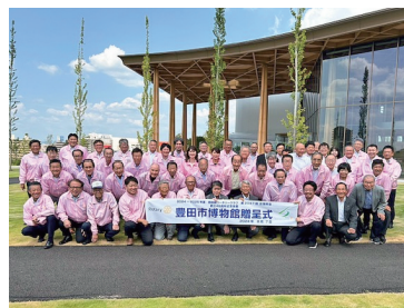
創立45周年記念事業