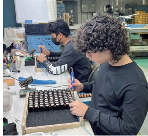
職業体験中の外国人青少年

クラブ会員の弁護士、社労士、外国人労働者を雇用している製造業の方に、それぞれの分野から役に立つ就職スキル研修を実施し、外国人青少年に受講していただいたり、クラブ会員企業に、職業体験として外国人青少年を受け入れていただきました。