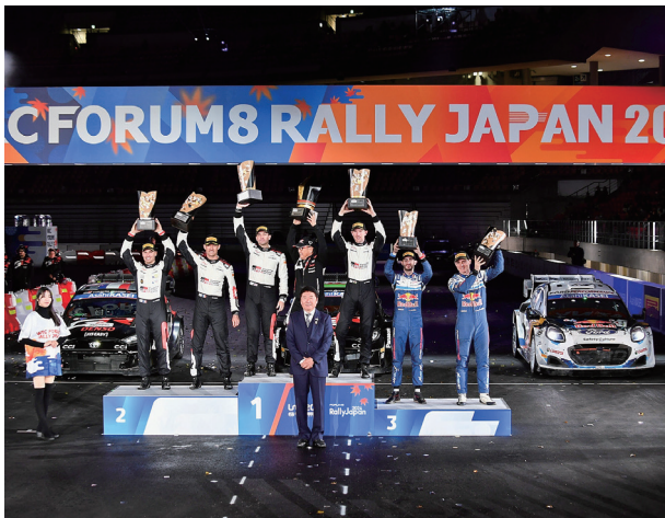
豊田市 ラリージャパン表彰式