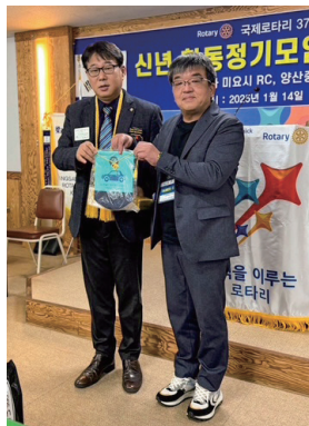
バナープレゼント

本年度は、前年度に友好クラブとして締結した、韓国釜山市の梁山(ヤンサン)中央RCへ訪問しました。双方で連携し、先ずは相互理解を深め、これから先の連携した奉仕活動を継続するために、様々な議論を現地で行いました。また、梁山中央RCの例会場及び懇親会では近隣クラブの方々も参加してくださり、大盛況の中、多様な方々と交流を深める事ができました。今後も梁山中央RCメンバーを定期的に当クラブへお招きし、合同例会を行い、更に友好を深めていきます。