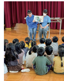
とよた学生プロジェクト