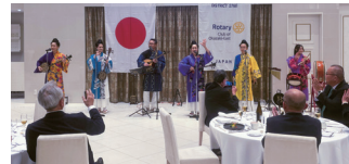
年忘れ親睦家族例会