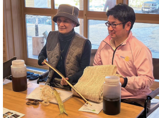
こうぞを使った糸づくり(アースワーカーエナジーへの支援)

10周年に向けて、愛知三州ロータリークラブを多くの人たちに知ってもらえるような活動を、今後も継続していきたいと思えます。