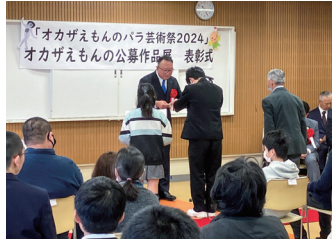
パラ芸術祭 表彰式

今年度の主な活動として、社会福祉法人岡崎市社会福祉協議会様のご協力をいただきながら、市から教育支