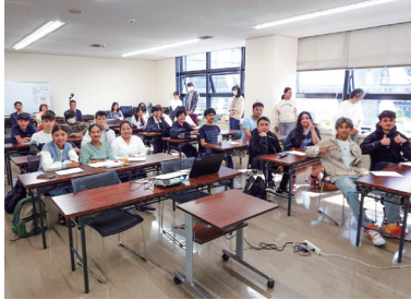
受講する外国人青少年

2024-25年度豊田西ロータリークラブは会長方針「ロータリアンよ 寛容であれ」のもと、様々な事業に挑戦して参りました。外国人青少年へのキャリアサポート教育の支援として、就職に役立つスキル研修を支援し、職業体験を実施することにより、外国人青少年が日本社会での働き方やキャリア形成について理解を深める機会を提供させていただきました。