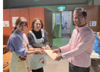
子ども食堂(絵本食堂どうぞの店)にクリスマスケーキ代を寄付