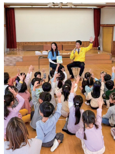
読み聞かせ前のふれあい