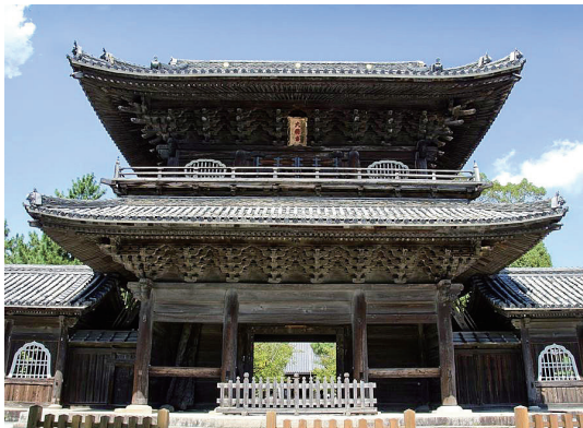
岡崎市 家康公ゆかりの地大樹寺