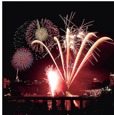
岡崎市 岡崎城下家康公夏祭り花火大会 伝統産業「三河花火」