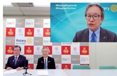
地区内の状況について