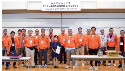
防災デイキャンプ開催

西三河里親会のご家族を対象に防災デイキャンプを開催支援することで、里親・里子の自然災害に対応する知識(避難場所・備蓄品等)を深めることができ、メンバーは里親委託(家庭養護)への重要性を学ぶ機会となりました。