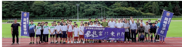
岡崎聾学校陸上部との交流会