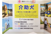
社会奉仕事業 介助犬PR看板