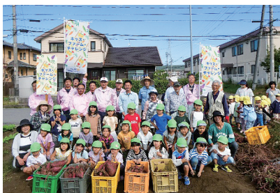
キッズファームチャレンジ

創立45周年の記念事業の一環として豊田市博物館に小型双眼鏡を寄贈しました。また、子ども食堂への支援やキッズファームチャレンジ、そして第31回を迎える豊田東RC杯争奪軟式少年野球大会の開催、鈴木正三顕彰事業などを行い会員相互の親睦を図るための親睦旅行、クリスマス家族例会なども実施しており充実したクラブ活動をしております。